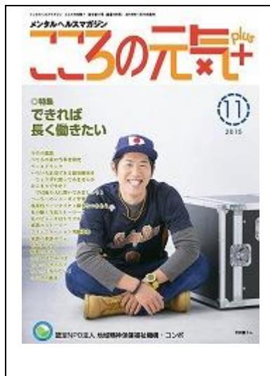
啓発誌「ココロの元気+」11月号