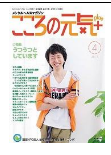
啓発誌「ココロの元気+」4月号