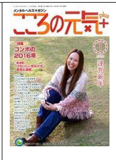
啓発誌「ココロの元気+」1月号