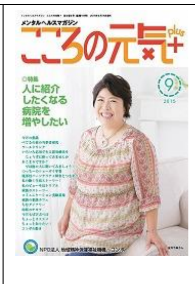
啓発誌「こころの元気+」9月号