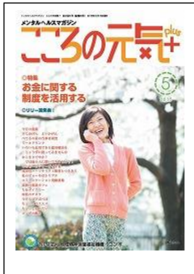
啓発誌「こころの元気+」5月号

1) 啓発冊子「こころの元気+」 毎月10,000部×12回(10,000部/月×12回/年)