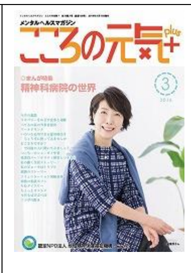
啓発誌「ココロの元気+」3月号