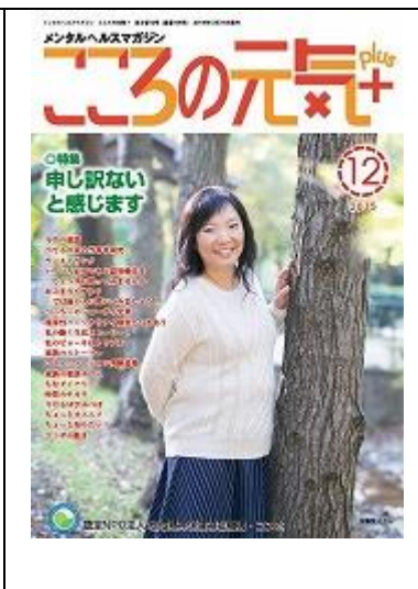
啓発誌「ココロの元気+」12月号