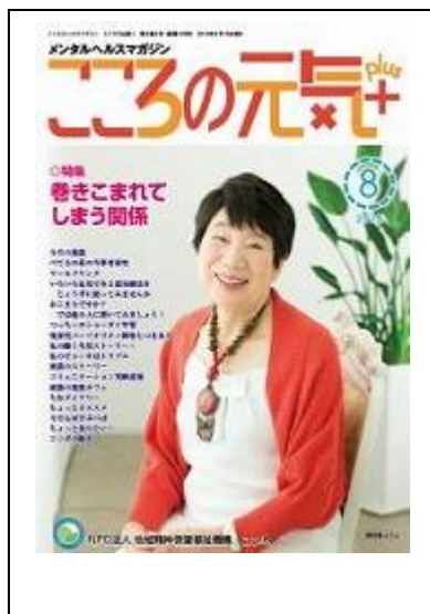
啓発誌「こころの元気+」8月号