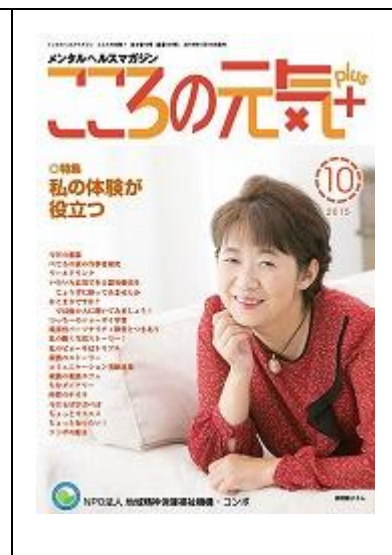
啓発誌「こころの元気+」10月号