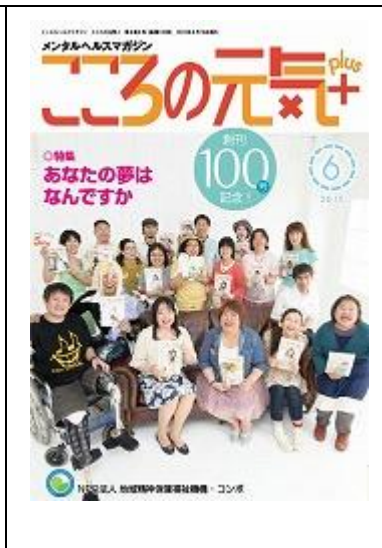
啓発誌「こころの元気+」6月号