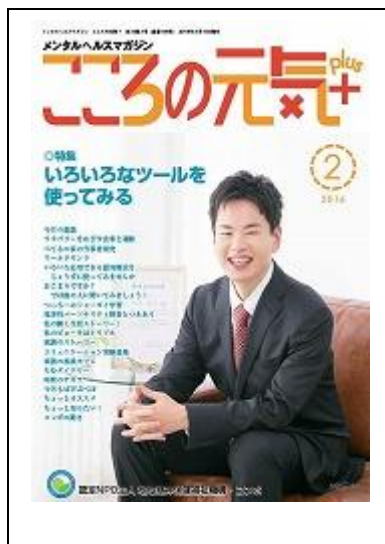
啓発誌「ココロの元気+」2月号